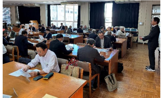
後援会評議員会の様子

また、評議員会終了後、町内会長さんと町内代表の生徒とPTA地域部の保護者とで、地域貢献活動と募金活動の打ち合わせを行いました。ほとんどの地域部の保護者の皆さんからも参加いただき、本当にありがたく思います。私は、 創立80周年が、今まで以上に学校と地域と保護者を繋げてくれているように感じます。ここに周年行事の良さがあります。 すばらしい1年にしたいと思います。今年度も直江津中学校をよろしくお願いいたします。