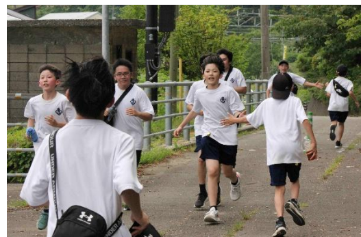
お互いにタッチして励まし合う姿

5月28日(木)に、直江津中伝統行事のがんばり行軍を行いました。自転車道の復旧が間に合わず、2年連続丹原で折り返し、たにはま公園を經由し直江津中学校を目指す21.7kmの短縮コースでしたが、普段1日で歩く数倍もある距離は、決して楽なものではありませんでした。途中すれ違う区間では生徒同士がハイタッチする姿がありました。また、追い越す時も「頑張っ」の励まし合う声も沢山聞かれました。 皆でお互いを励まし合う。これががんばり行軍の良さです。今年もすてきな光景が沢山見られました。