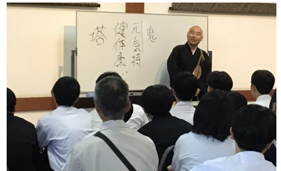
薬師寺のお坊さんからためになる法話を聞く

3年生は、5月21日(木)～23日(土)の2泊3日で、奈良・京都に修学旅行に行ってきました。一日目、東大寺でガイドさんの案内が終わり、「この場所に17:40に集合」と指示が出されて自由行動になりました。私は皆さんの集合した時刻に驚きました。整列し点呼を完了したのが17:35だったのです。宿に到着し夕食会場への集合時刻18:35にも、全員が集いました。その後も、時間に合わないことでヤキモキする場面は見られませんでした。私にとって15回目の修学旅行は、ダントツ時間を守って行動してくれた修学旅行でした。 数秒や数分の遅刻は、「そのくらい構わないだろう」という甘えや、相手を甘くみていたり、大切に思っていなかったりすることが原因で起きていることが多いそうです。時間を守れることは、相手を大切に思っているからこそできることです。私は、3年生が仲間を大切に思うすばらしい学年だと心から思いました。本当にすてきな修学旅行でした。