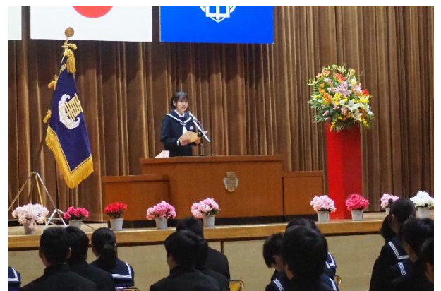
生徒会長の歓迎の言葉