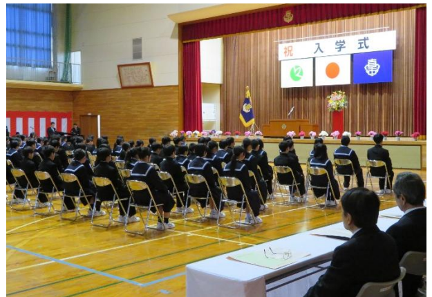
1年生が入場し整然と座っている様子

多数のご来賓方から入学式に参列いただき、ありがとうございました。ある町内会長さんから、「立派な式で感動しました」とお褒めの言葉をいただきました。これからも直江津中学校へのご支援をよろしく願いいたします。