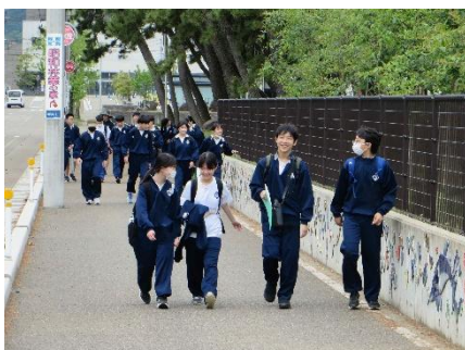
2年生 語りながら目的地を目指す