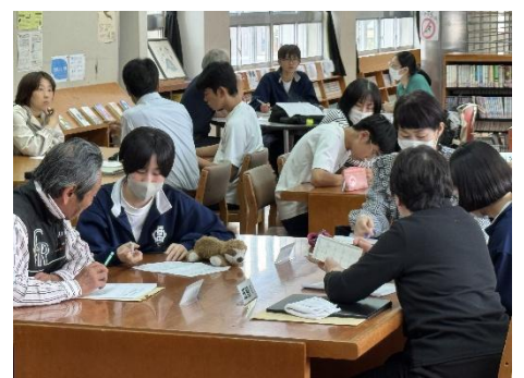
町内会長さんとの打ち合わせの様子

後援会理事会・評議員会終了後に、各町内の代表生徒とPTA地域部の保護者と町内会長さんとで、地域貢献活動の打ち合わせを行いました。6月28日を皮切りに地域貢献活動がスタートします。生徒の活動にご協力とご支援をよろしくお願いたします。