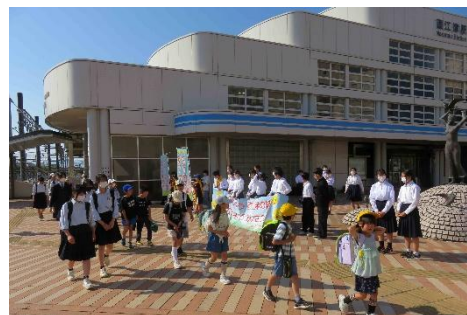
直江津駅でのあいさつ運動の様子

6月4日(水)から6日(金)の3日間、春のあいさつ運動を実施しました。中学校生徒玄関前、直江津駅前、直江津郵便局、うみがたり交差点の4か所で、地域の方や小学生と一緒に、さわやかなあいさつを行いました。地域の方から「こうして中学生が立って、あいさつしてくれると、町全体が元気になる。とってもありがたい。」とのお言葉をいただきました。皆さんの活動が、町を元気にしてくれています。秋にもあいさつ運動を実施します。直江津地区が元気になるよう、皆さんの優しさと力をまた貸してくださいね。