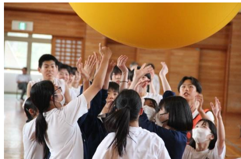
3年生 人生初の大きな大玉送りの様子